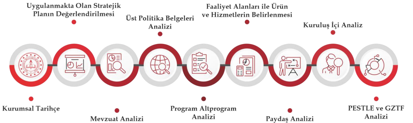
Şekil.1. Durum Analizi